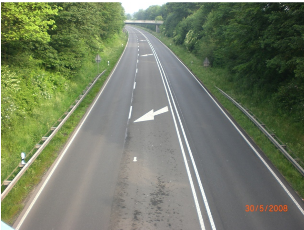
Obr. 1: Německo (B 54)

Šířkové uspořádání 2+1 spočívá v přidání předjížděcího jízdního pruhu do dvoupruhového uspořádání a oddělením jízdních směrů buď pomocí svodidel (Švédsko) nebo pouze vodorovným dopravním značením (např. Německo).