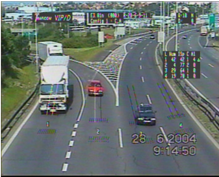
Obr. č. 6b