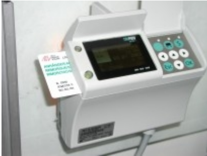
Obr. 1: OBU - palubní jednotka On Board Unit

Výběr poplatků (mýtného) podle výkonu (na základě počtu ujetých km) pro všechny nákladní automobily nad 3,5 tuny určené pro převoz zboží představuje 97% všech výnosů. Další 3% poplatků jsou realizovány formou výběru paušálních poplatků (ročních, denních) za provoz autobusů, přívěsů, apod. Výjimky z placení poplatků platí pro vojenská vozidla, vozidla policie, hasičů a záchranné služby, vozidla s elektrickým pohonem a některé další speciální případy (např. vozidla svážející dřevo).