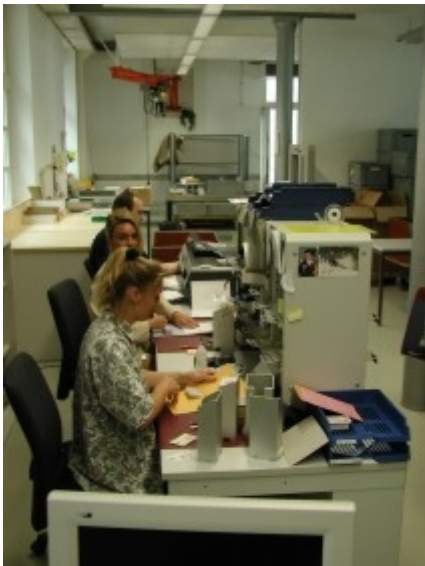
Obr. 2: Zúčtovací pracoviště v Bernu

Denně se výběr poplatků týká cca 52 000 vozidel a 30 000 přívěsů ve vnitrostátní přepravě a cca 21 000 vozidel zahraniční přepravy (cca 50% z těchto vozidel představuje vjezd přes státní hranice a cca 50% výjezd za hranice státu). Jak již bylo shora uvedeno, výběr poplatků za použití švýcarských komunikací podle výkonu se týká všech vozidel s maximální celkovou hmotností nad 3,5 tuny. Protože je výběr prováděn za každý ujetý km v kompletní silniční síti, jedná se o plošný výběr.