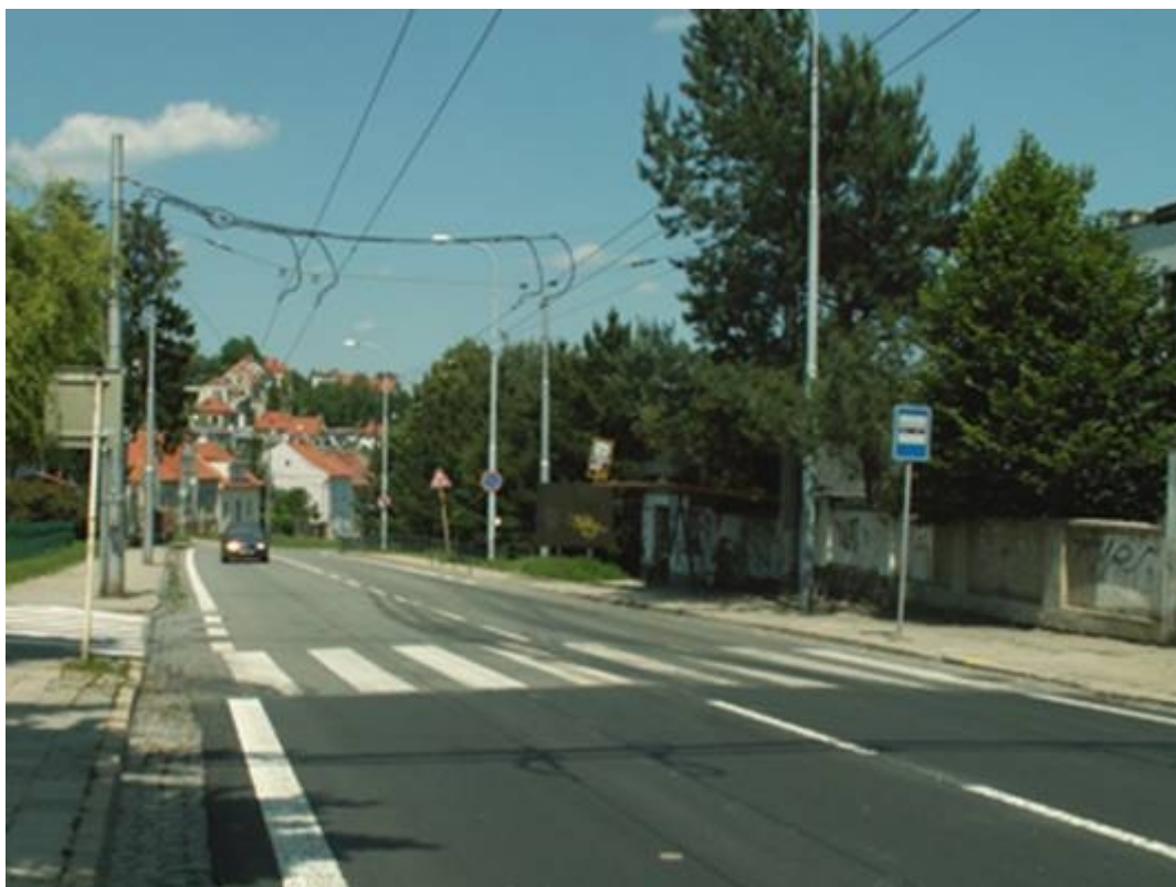
Obr 2: Mapa lokality s červeně vyznačenou polohou zařízení pro provozní informace (ZPI), radaru na měření rychlosti (R) a sledovaného přechodu pro chodce

V městské části Brno-Nový Lískovec byl vznesen požadavek na zvýšení bezpečnosti na přechodu pro chodce na ulici Rybnické. V lokalitě se nachází mateřská škola, základní škola, autobusové zastávky a přechod pro chodce. Úmyslem bylo snížení průjezdní rychlosti vozidel.