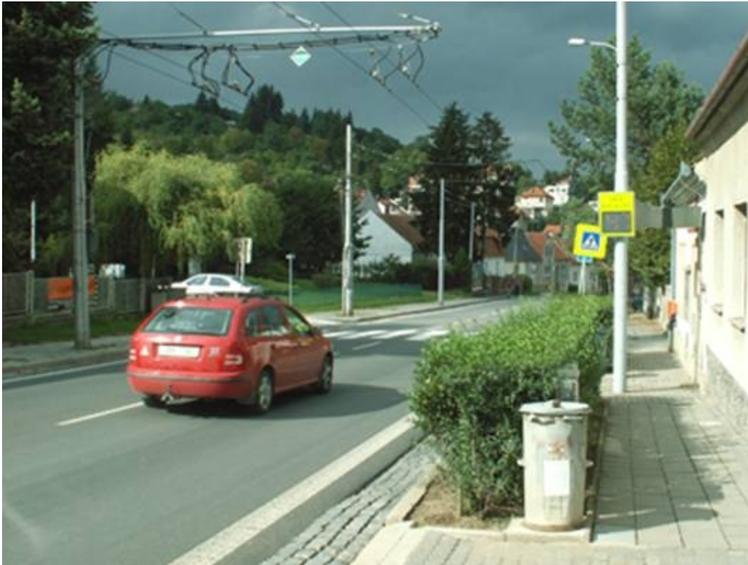
Obr 4: Detailní pohled na displej zařízení pro provozní informace

Měření rychlosti vozidel proběhlo ve dvou etapách: v červnu 2006 před instalací zařízení pro provozní informace a v srpnu 2006 po jeho instalaci. Měřila se rychlost vozidel v jízdním pruhu přilehlém instalovanému zařízení (směr Pisárky), tj. těch, na které má zařízení preventivně působit. Rychlost se měřila profilově pomocí dopplerovského radaru.