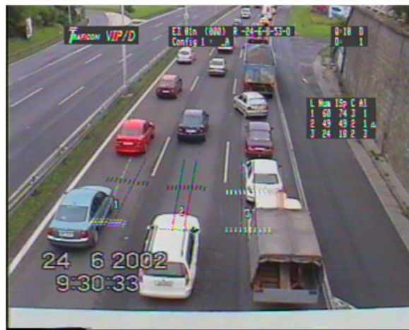
Obr. 5 Schéma a základní reálný videoobraz sledovaného odbočování

Zde je patrné jak vratná rampa pro kterou nestačí odbočovací pruh způsobuje „zahlcení“ pravého jízdního pruhu a tento vliv se postupně přenáší na ostatní jízdní pruhy (jak deklarují grafy závislosti), vozidla, která nechtějí čekat, odbočují až v bezprostřední blízkosti rampy tj. ze středního jízdního pruhu.