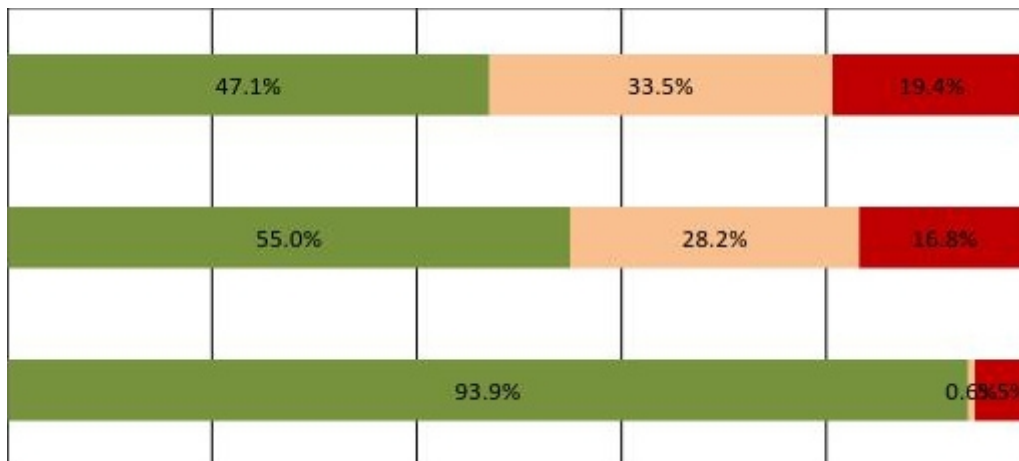
Graf 2. - Chování účastníků silničního provozu na železničních přejezdech s PZS bez závor