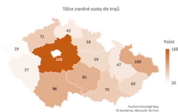
Obrázek 2 Těžce zraněné osoby dle krajů 2011-2020

Dopravní nehody způsobené námrazou, sněhem a náledím mají přirozeně sezónní povahu. K závažným nehodám tak docházelo zejména v prvních třech a posledních dvou měsících jednotlivých let. Závažné následky nehod způsobené tímto vlivem však tvořily malé procento všech závažných následků nehod za těchto 5 měsíců v rámci let 2011-2020. Relativní podíl usmrcených osob při nehodách tohoto typu ke všem usmrceným osobám při dopravních nehodách činil 8,4 %. V případě těžkých zranění se jednalo o 11,8 %.