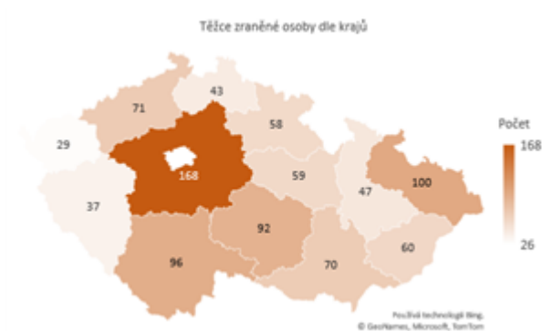
Obrázek 2 Těžce zraněné osoby dle krajů

Dopravní nehody způsobené námrazou, sněhem a náledím mají přirozeně sezónní povahu. K závažným nehodám tak docházelo zejména v prvních třech a posledních dvou měsících jednotlivých let. Závažné následky nehod způsobené tímto vlivem však tvořily malé procento všech závažných následků nehod za těchto 5 měsíců v rámci let 2011-2020. Relativní podíl usmrcených osob při nehodách tohoto typu ke všem usmrceným osobám při dopravních nehodách činil 8,4 %. V případě těžkých zranění se jednalo o 11,8 %.