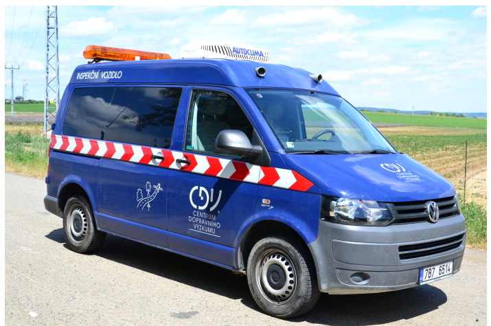
Měřicí vozidlo (inspekční vozidlo)