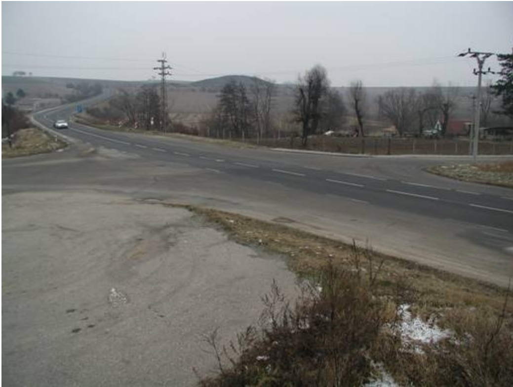
Obr 2: Pohled na křižovatku před úpravou (foto 12/2002, směr Vyškov)

Na základě návrhu stavebních opatření (CDV, 12/2002) byla provedena zklidňující opatření – ochranný ostrůvek na přechodu pro chodce. Dále byla svislou dopravní značkou snížena nejvyšší dovolená rychlost na 70 km/h).