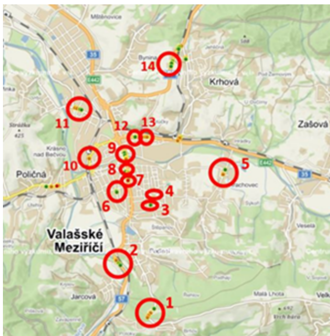
Obr. 2 Shluky dopravních nehod ve Valašském Meziříčí

Z uvedených parametrů vyplynula následující místa dopravních nehod, znázorněná na Obr. 2.