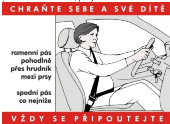
Obr. 2: Těhotná-řidička

Samolepky vlepujeme do těhotenských průkazek od října 2003. Idea samolepky do Průkazky pro těhotné byla schválena a podpořena výborem České gynekologické a porodnické společnosti. Je patentově ošetřena (příhláška užitého vzoru je evidována na Úřadu průmyslového vlastnictví Praha dnem 5.2.2004 pod zn.spisu: PUV 2004-15037).