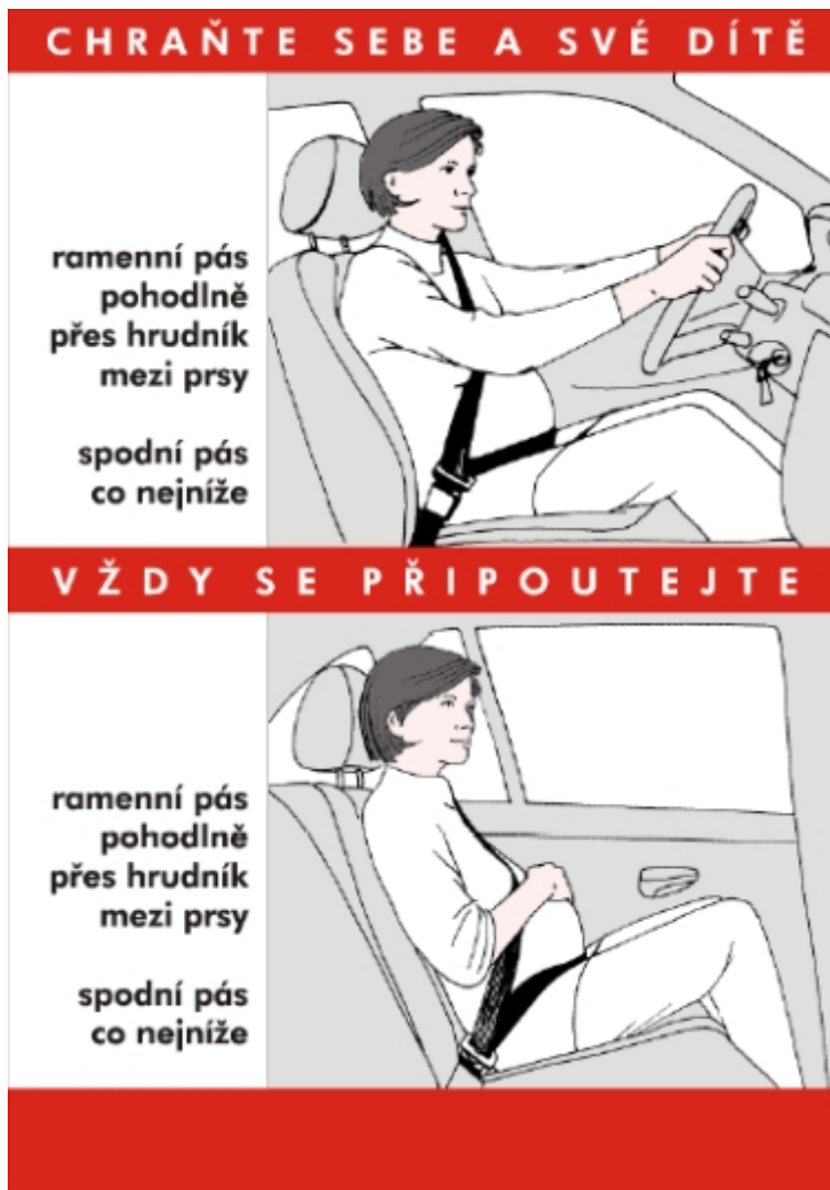
Obr. 3: Plakátek do čekárny Poradny pro těhotné (A3 nebo A4)

Čím dříve tuto srozumitelnou informaci těhotným ženám (ale i široké veřejnosti) nabídneme, tím rychleji a účinněji přispějeme ke zvýšení bezpečnosti našich žen a jejich dětí.