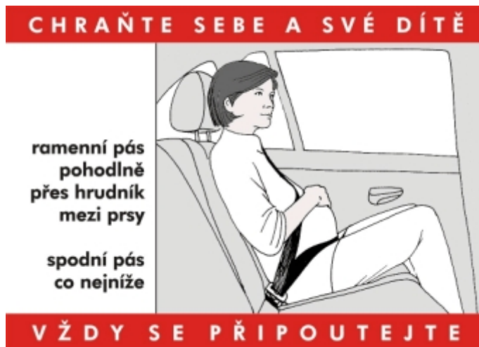
Obr. 1: Těhotná-spolucestující