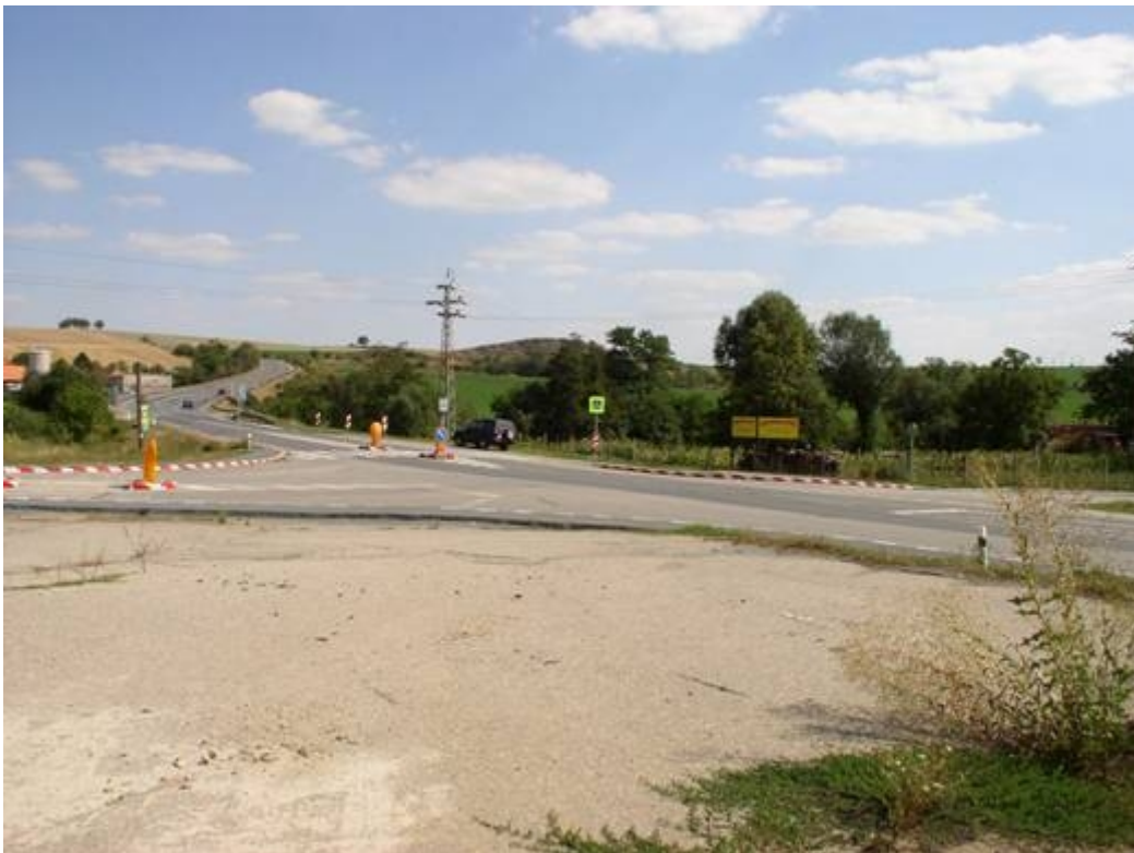
Obr 4: Ochranný ostrůvek

Měření v roce 2004 prokázala snížení rychlosti: např. rychlost V85 uprostřed křižovatky se snížila z 90 km/h (2002) na 75 km/h, tj. o 15 km/h.