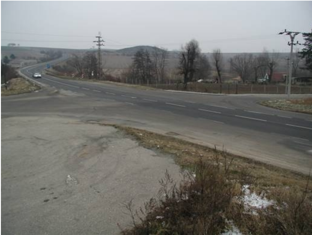
Obr 2: Pohled na křižovatku před úpravou (foto 12/2002, směr Vyškov)

Na základě návrhu stavebních opatření (CDV, 12/2002) byla provedena zklidňující opatření – ochranný ostrůvek na přechodu pro chodce. Dále byla svislou dopravní značkou snížena nejvyšší dovolená rychlost na 70 km/h).