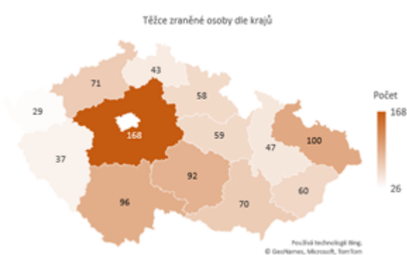
Obrázek 2 Těžce zraněné osoby dle krajů 2011-2020

Dopravní nehody způsobené námrazou, sněhem a náledím mají přirozeně sezónní povahu. K závažným nehodám tak docházelo zejména v prvních třech a posledních dvou měsících jednotlivých let. Závažné následky nehod způsobené tímto vlivem však tvořily malé procento všech závažných následků nehod za těchto 5 měsíců v rámci let 2011-2020. Relativní podíl usmrcených osob při nehodách tohoto typu ke všem usmrceným osobám při dopravních nehodách činil 8,4 %. V případě těžkých zranění se jednalo o 11,8 %.