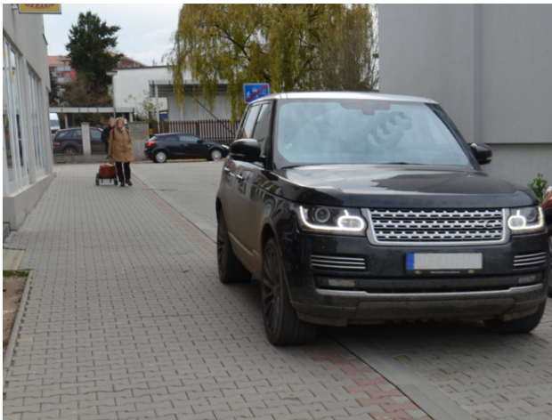
Obrázek 06. Benešov - před osazením