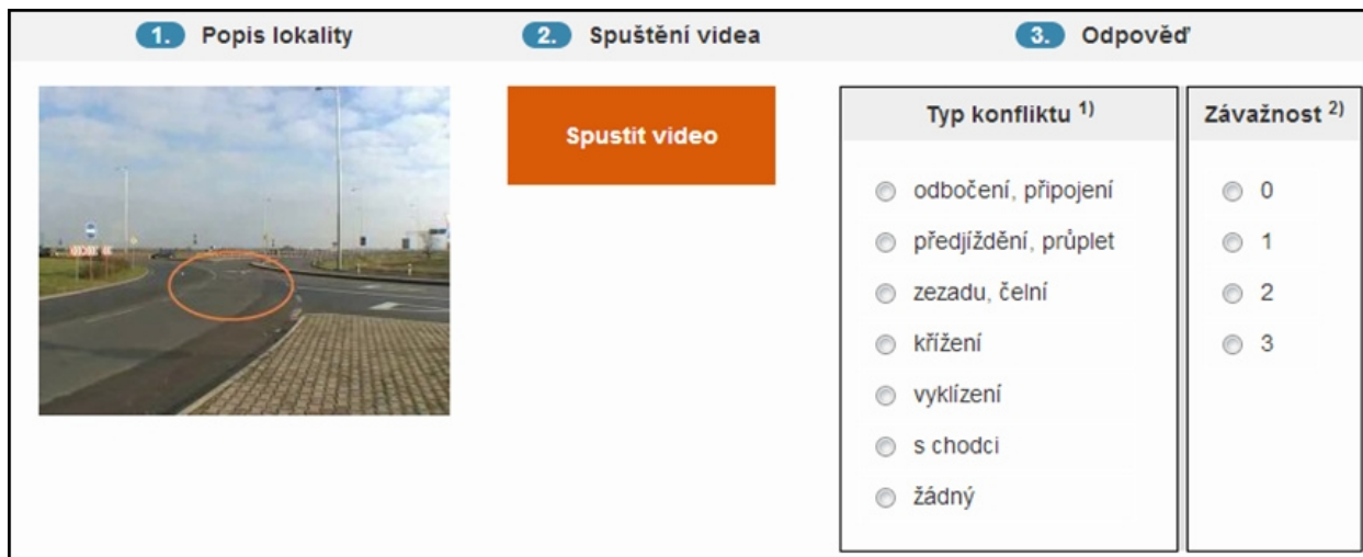
Obr. 1 Ukázka ze školicí aplikace