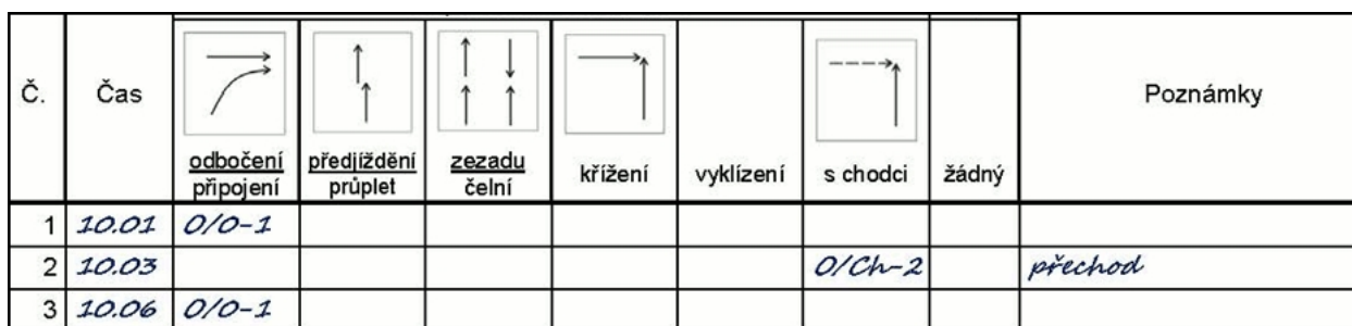
Obr. 2 Ukázka části formuláře sledování konfliktů

Pozorovatel klasifikuje konflikt do šesti typů a hodnotí stupně závažnosti podle intenzity úhybných manévrů (formulář viz Obr. 2). Ukázková videa typů i závažnosti jsou k dispozici v úvodu webové školicí aplikace. Při sledování se zároveň zaznamenává intenzita dopravy.