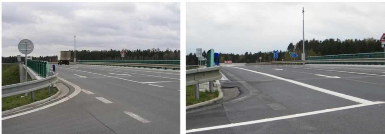
Obr. 3 Výhled řidiče na sledované lokalitě před a po úpravě VDZ

Pro ilustraci je dále změna dokumentována na fotografiích (Obr. 3). Vlevo je zřejmý původní problém – omezený rozhled při levém odbočení zapříčiněný blízkostí zábradelního svodidla; fotografie vpravo ilustruje stav po úpravě VDZ.