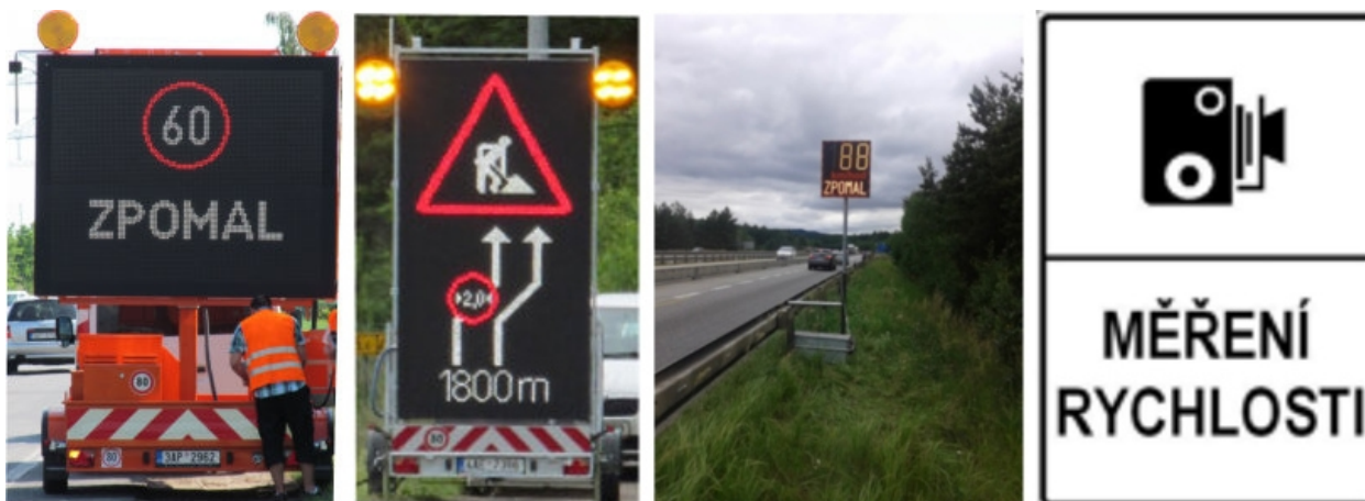
Obr. 3 - Testovaná opatření v místech dopravních uzavírek v rámci řešení projektu ASAP

Hlavním cílem projektu ASAP je vyzkoušet efektivitu vybraných opatření, která povedou k lepšímu řízení rychlosti vozidel projíždějících pracovními místy, protože nedodržování nejvyšších dovolených rychlostí je celoevropským problémem a na pracovních místech o to závažnějším. Z tohoto důvodu byl v rámci uvedeného projektu vytvořen seznam jednoduchých opatření nezasahujících do vozovky (zobrazování aktuální dosahované rychlosti, použití proměnných dopravních značek při překročení nejvyšší dovolené rychlosti, zdůraznění/opakování dopravní značky č. A 15 Práce na silnici, instalace dopravní značky č. IP 31 a Měření rychlosti).