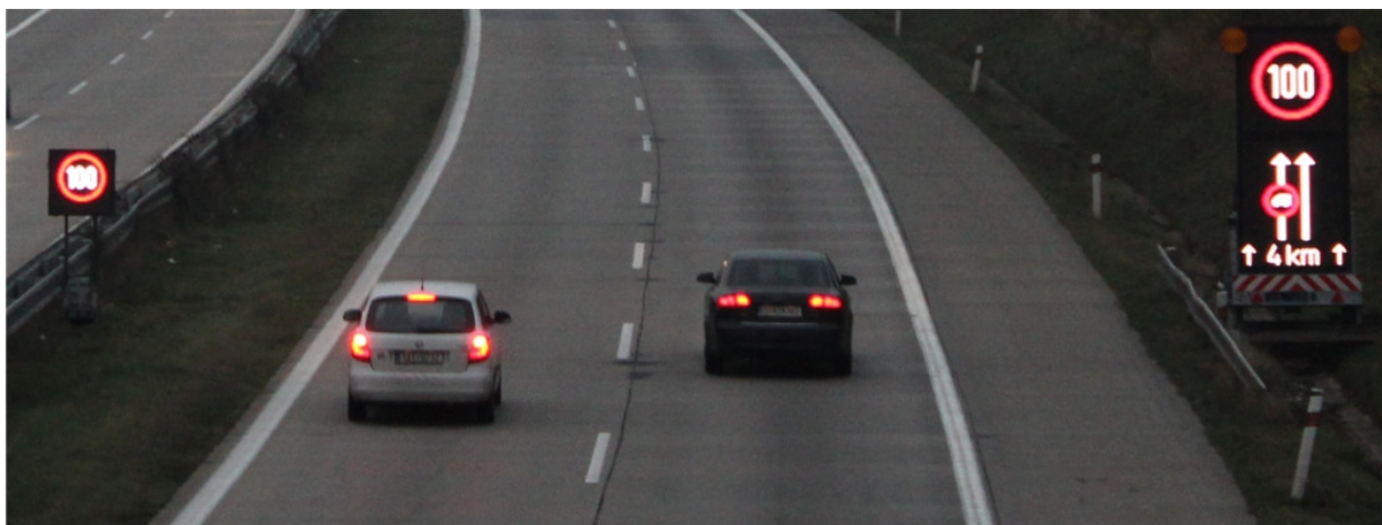
Obr. 2 - Fotografie z pilotního testování systému ViaZONE