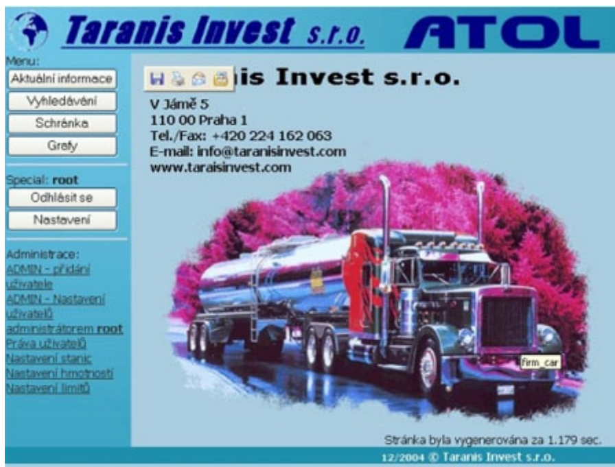
Obr. 3.3-1: Základní okno aplikace

Obrázek 3.3-1 znázorňuje základní okno aplikace. Zde je možný přístup k jednotlivým funkcím a modulům ATOLu. Základní menu se skládá z následujících položek: