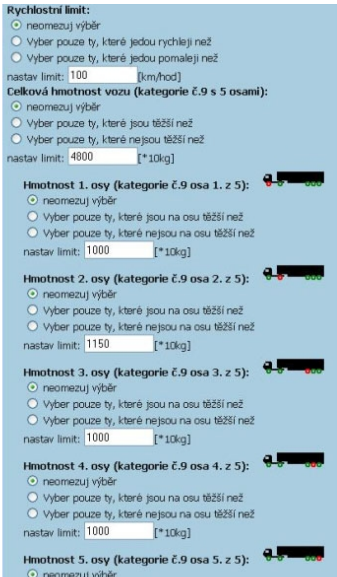
Obr. 3.5.2-2: Výběr a definice parametrů