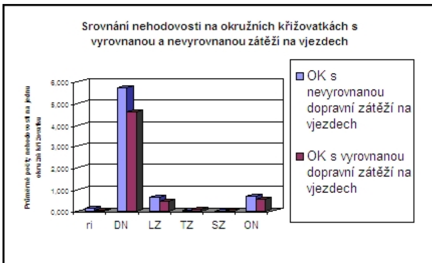
Graf: Srovnání nehodovosti na okružních křižovatkách s vyrovnanou a nevyrovnanou zátěží na vjezdech