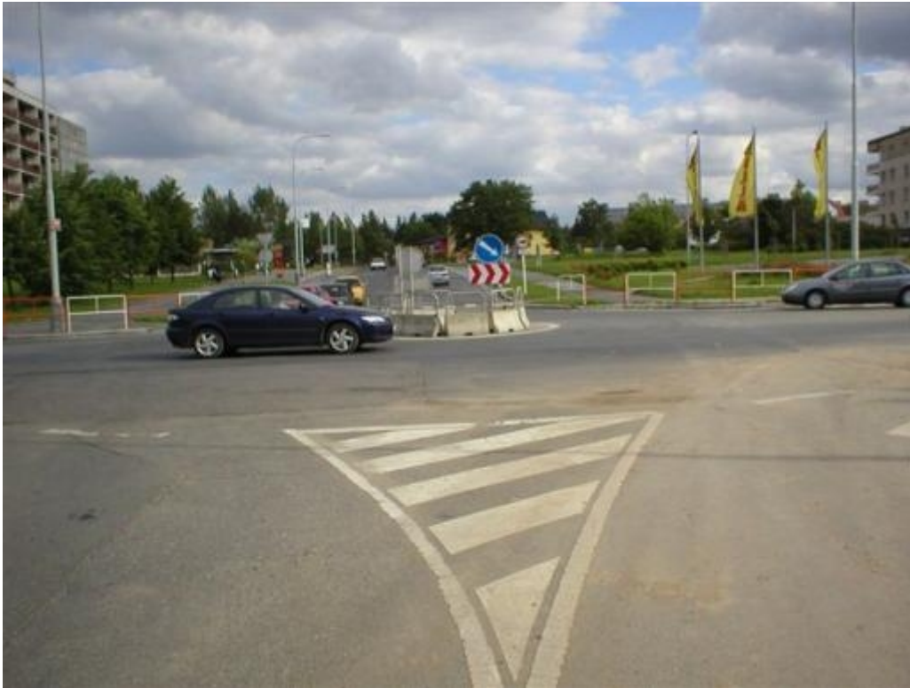
Praha - příklad problematické architektury