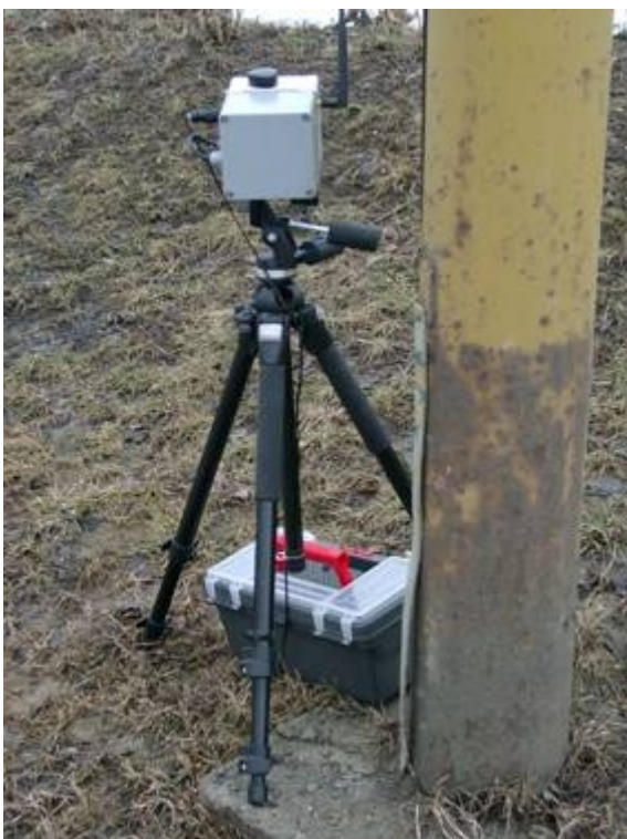
Obrázek 4 - Radar umístěný za sloupem veřejného osvětlení

K měření rychlostí jsou používány radary výrobního označení Falcon Plus II/III pracující na dopplerovském principu. Dva používané typy radaru se liší šířkou vyzařovaného svazku paprsků. Model Falcon Plus II zaznamenává vozidla v oblasti 11^\circ \times 11^\circ (vodorovný \times svislý úhel), druhý typ Falcon Plus III disponuje rozsahem 11^\circ \times 18^\circ . Standardně dodávaný radar je rozšířen o jednotku umožňující bezdrátový přenos dat mezi radarem, měřícím vozidlem a notebookem. Pochází od výrobce VIA Traffic Controlling GmbH (Leverkusen, SRN). Radar je použitelný pro práci ve venkovním prostředí: pracuje při teplotách -40^\circ\text{C} až +70^\circ\text{C} a celá jeho vnitřní část je chráněna před vodou, prachem a před kondenzací vnitřní vlhkosti vyvolané teplotou.