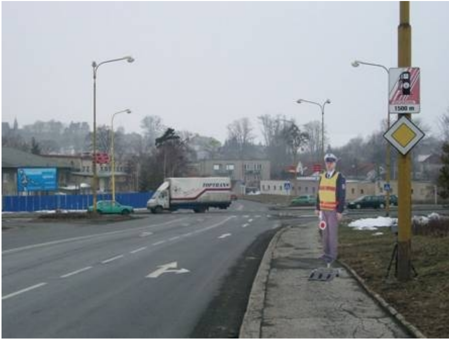
Obrázek 3 - figurína policisty na stanovišti č. 2