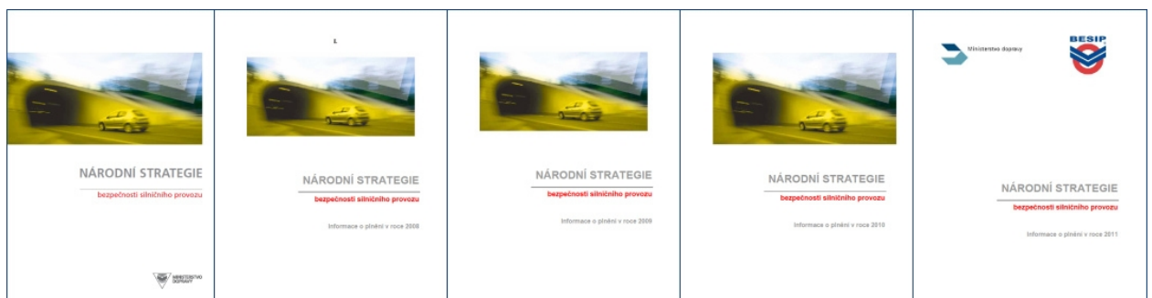
Obr. 2 - NSBPS 2004-2008, Informace o plnění NSBSP209-2011,

Základním vrcholným materiálem v oblasti bezpečnosti je již od roku 2004 Národní strategie bezpečnosti silničního provozu (dále NSBSP). CDV se tvorbě materiálu významně podílelo. Následně v roce 2007 zpracovalo revizi NSBSP - Národní strategie bezpečnosti silničního provozu na roky 2008-2010. V poslední dekádě pak byl zpracován doposud poslední materiál - vládní dokument Národní strategie bezpečnosti silničního provozu pro roky 2011-2020.