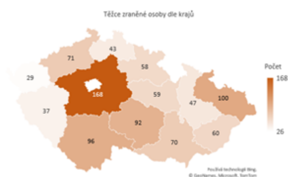
Obrázek 2 Těžce zraněné osoby dle krajů

Dopravní nehody způsobené námrazou, sněhem a náledím mají přirozeně sezónní povahu. K závažným nehodám tak docházelo zejména v prvních třech a posledních dvou měsících jednotlivých let. Závažné následky nehod způsobené tímto vlivem však tvořily malé procento všech závažných následků nehod za těchto 5 měsíců v rámci let 2011-2020. Relativní podíl usmrcených osob při nehodách tohoto typu ke všem usmrceným osobám při dopravních nehodách činil 8,4 %. V případě těžkých zranění se jednalo o 11,8 %.