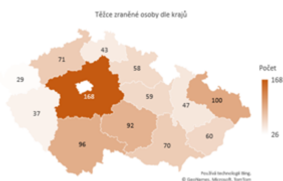
Obrázek 2 Těžce zraněné osoby dle krajů

Dopravní nehody způsobené námrazou, sněhem a náledím mají přirozeně sezónní povahu. K závažným nehodám tak docházelo zejména v prvních třech a posledních dvou měsících jednotlivých let. Závažné následky nehod způsobené tímto vlivem však tvořily malé procento všech závažných následků nehod za těchto 5 měsíců v rámci let 2011-2020. Relativní podíl usmrcených osob při nehodách tohoto typu ke všem usmrceným osobám při dopravních nehodách činil 8,4 %. V případě těžkých zranění se jednalo o 11,8 %.