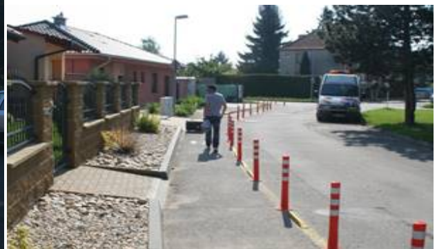
Obrázek 11. Břeclav – krátce po osazení

Pohyb chodců zůstal zachován na vymezeném prostoru. Do odděleného prostoru se přesunuli i cyklisté (v navazující ulici za křižovatkou je pro ně vyhrazený jízdní pruh a vznikla tak návaznost trasy). Reakcí rezidentů a majitelů přilehlých nemovitostí byl spíše údiv. Padlo pár předpovědí: „Tohle tady nemůže přece přežít.“ Opak je pravdou. Všechny sloupky přešly monitorovací období bez úhony pouze s drobnými oděrkami na exponovaných místech (odstraněn byl pouze jeden sloupek, který majitelům přilehlé nemovitosti překážel ve vjezdu – ovšem až po 11 měsících provozu). Nejvíce trpěly krajní sloupky a sloupky po krajích vjezdů. Místa byly strženy reflexní pásy, ale jinak dopravní a klimatické zatížení nemělo žádný vliv na tvar nebo funkci sloupků.