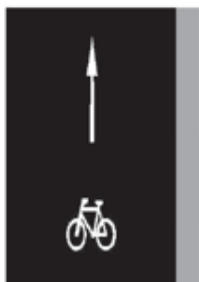
Jízdní pruh pro cyklisty V 14

Značka vyznačuje pruh nebo stezku pro cyklisty. Šipka vyznačuje stanovený směr jízdy.