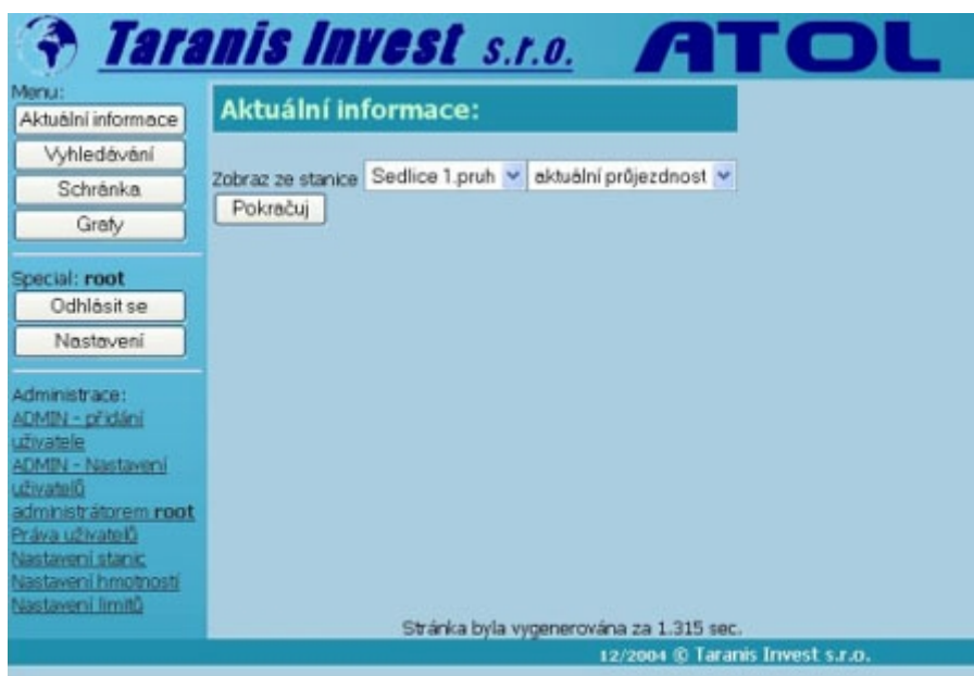
Obr. 3.4-1: Aktuální informace