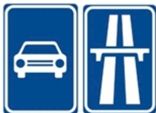
Staré svislé dopravní značení

Pro komunikaci označenou jako „Silnice pro motorová vozidla“ i pro „Dálnice“ však stále platí, že v úseku procházející obcí je nejvyšší dovolená rychlost 80 km/h .