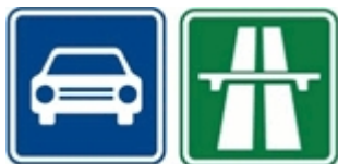
Nové svislé dopravní značení

Další změnou je označení dopravního okruhu, nebo také městského okruhu, která se dočkala výraznějších úprav. Tato značka „ Okruh “, která označuje okruh zřízený pro objíždění obce nebo její části, může být doplněna názvem okruhu, nebo jeho číslem. Nesmíme zapomenout, že takto označená komunikace má svá omezení, např. na takto označení komunikace není možné s vozidlem stát.