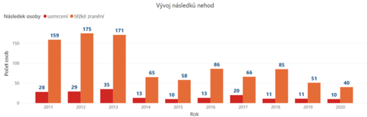
Graf 2 Vývoj závažných následků nehod vzniklých v důsledku vlivu námrazy, sněhu či náledí

Z hlediska regionálního rozložení je možné konstatovat, že k největšímu počtu nejvážnějších nehod v letech 2011-2020 došlo ve Středočeském kraji (193). Nejvíce úmrtí v důsledku nehod vlivem námrazy, sněhu či náledí bylo evidováno v Jihočeském kraji (29).