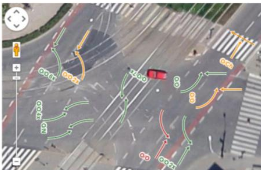
Příklad části konfliktního diagramu na podkladu ortofotomapy

Záznamy konfliktů lze zpracovat v tzv. vizualizační aplikaci – výsledkem je konfliktní diagram (analogie kolizního diagramu, který se vytváří na základě dopravních nehod). V diagramu se používají grafické symboly typů konfliktů, popis uvádí zkratky kategorií účastníků konfliktu, závažnost se rozlišuje barvami (zelená, oranžová, červená). Zároveň se vyhodnotí zaznamenaná intenzita.