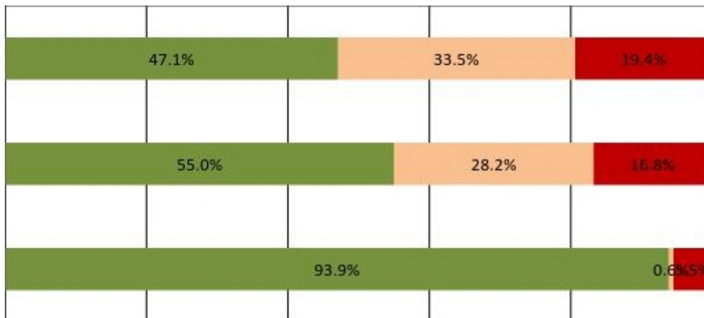
Graf 2. - Chování účastníků silničního provozu na železničních přejezdech s PZS bez závor