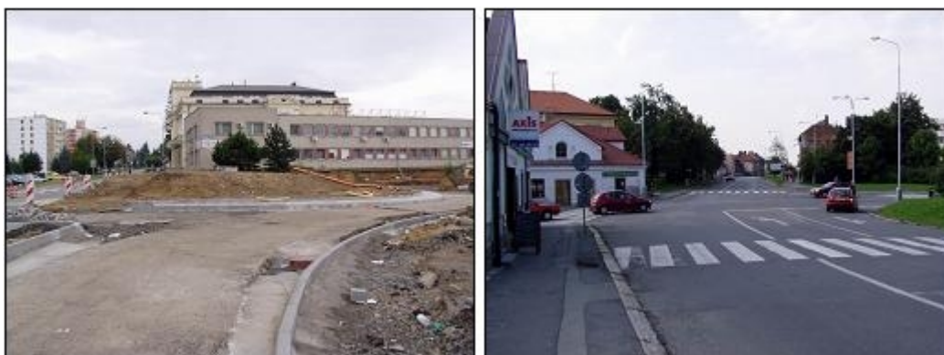
Obr.1 - Vybudovat okružní nebo světelně řízenou křižovatku? Anebo ponechat stávající stav? (Hranice a Čáslav, 2005)

Zdroje určené na financování realizace dopravně bezpečnostních opatření jsou omezené (lépe řečeno jsou velmi malé). Proto je důležité tyto omezené zdroje co nejefektivněji využívat. Tradičními kritérii při rozhodování o realizaci vhodného dopravně-bezpečnostního opatření je jeho legitimita, vhodnost (dopravně inženýrská, občas bohužel i politická) a účinnost. Pro posuzování účinnosti dopravně-bezpečnostních opatření jsou k dispozici vhodné nástroje ( efficiency assessment tools - EATs ), pomocí kterých je možné vybrat mezi možnými opatřeními ty s nejvyšší mírou finanční návratnosti. Mezi nejdůležitější nástroje pro toto vyhodnocování patří analýza efektivity nákladů - CEA ( cost-efficiency analysis ) a analýza nákladů a přínosů - CBA ( cost-benefit analysis ).