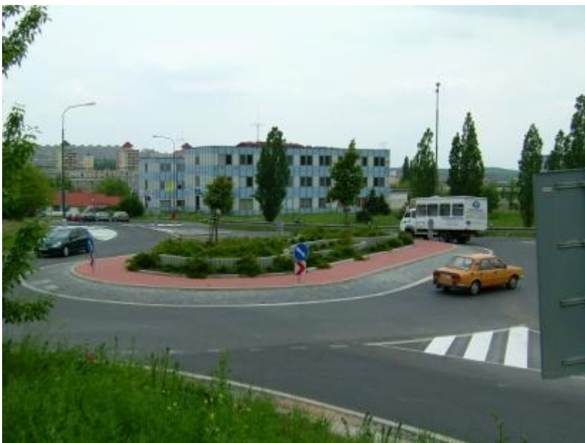
Most – příklad zdařilé architektury

Lze se domnívat, že rozdíl v provedení MOK spolupůsobí při bezpečnosti provozu. Ve skupině pražských křižovatek se vyskytují především křižovatky se strohým technicistním provedením s velmi potlačenou architekturou prostoru. Jako kontrast na následných fotografiích uvádíme pozitivní příklad křižovatky z Mostu s podařenou architektonickou úpravou (i když z technického hlediska je možné polemizovat o vhodnosti oválného tvaru středního ostrova). Rovněž bude užitečné zhodnotit a doporučit úpravu středního ostrova buď jako v úrovni, anebo s navýšenou úpravou.