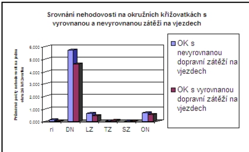
Graf: Srovnání nehodovosti na okružních křižovatkách s vyrovnanou a nevyrovnanou zátěží na vjezdech