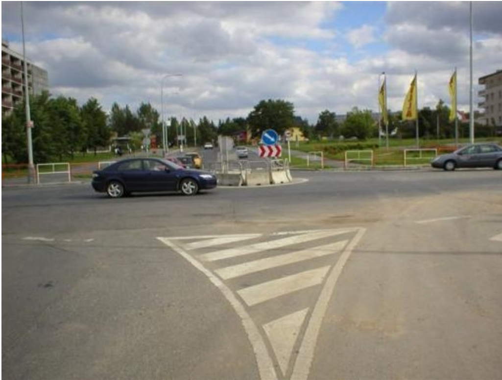
Praha - příklad problematické architektury