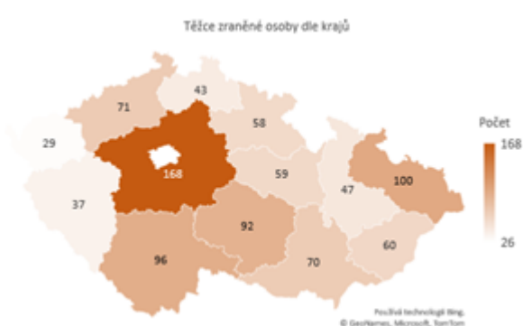
Obrázek 2 Těžce zraněné osoby dle krajů

Dopravní nehody způsobené námrazou, sněhem a náledím mají přirozeně sezónní povahu. K závažným nehodám tak docházelo zejména v prvních třech a posledních dvou měsících jednotlivých let. Závažné následky nehod způsobené tímto vlivem však tvořily malé procento všech závažných následků nehod za těchto 5 měsíců v rámci let 2011-2020. Relativní podíl usmrcených osob při nehodách tohoto typu ke všem usmrceným osobám při dopravních nehodách činil 8,4 %. V případě těžkých zranění se jednalo o 11,8 %.