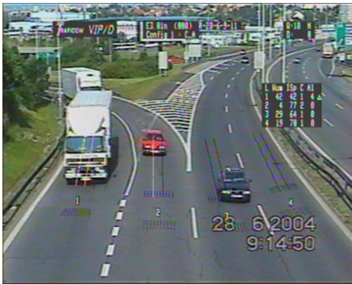
Obr. č. 6b