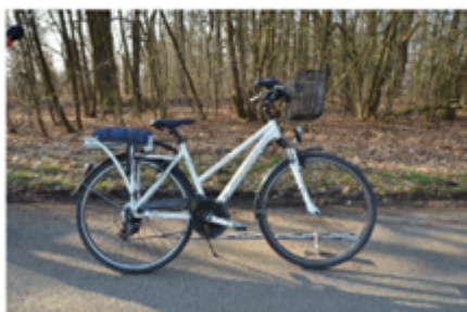
Cyklista nedostal přednost v jízdě (střetová rychlost 15 km/h) cyklista neměl přilbu, lehké zranění