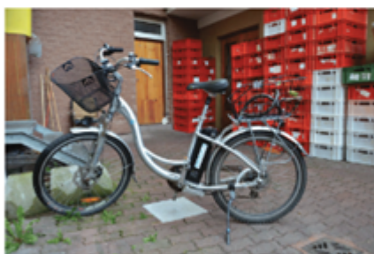
Nedání přednosti v jízdě (střetová rychlost 15 km/h) cyklista neměl přilbu, lehké zranění