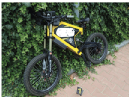
Nezákonný výkon a rychlost (střetová rychlost 15 km/h) cyklista neměl přilbu, těžké zranění