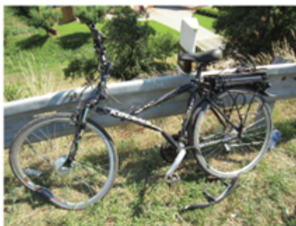
Vjetí do protisměru (střetová rychlost 30 km/h) cyklista měl přilbu, lehké zranění