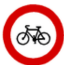
Zákaz vjezdu jízdních kol B 8