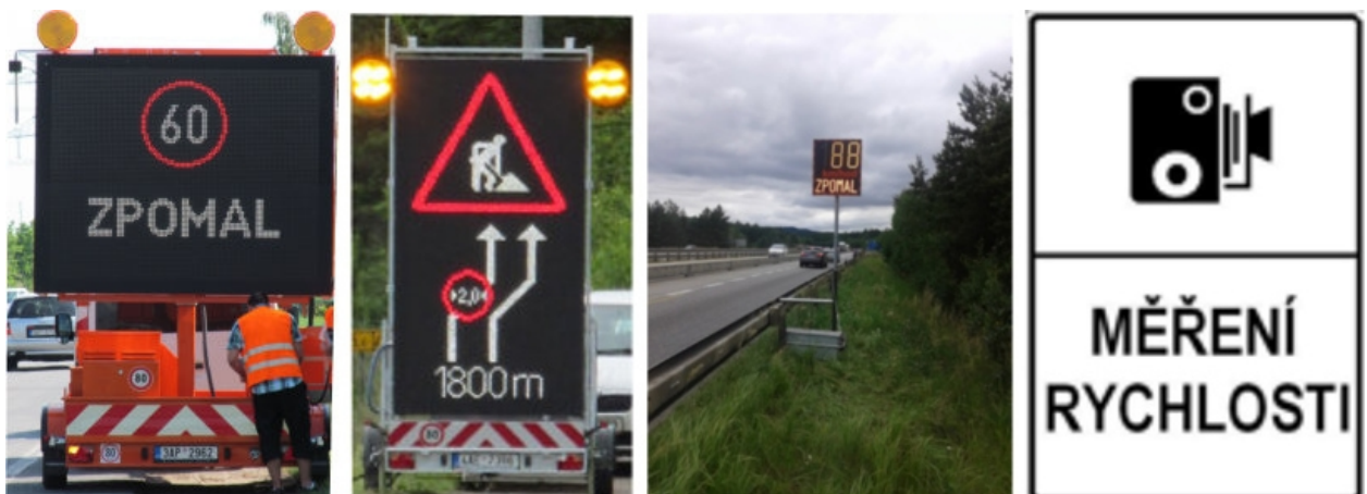
Obr. 3 - Testovaná opatření v místech dopravních uzavírek v rámci řešení projektu ASAP

Hlavním cílem projektu ASAP je vyzkoušet efektivitu vybraných opatření, která povedou k lepšímu řízení rychlosti vozidel projíždějících pracovními místy, protože nedodržování nejvyšších dovolených rychlostí je celoevropským problémem a na pracovních místech o to závažnějším. Z tohoto důvodu byl v rámci uvedeného projektu vytvořen seznam jednoduchých opatření nezasahujících do vozovky (zobrazování aktuální dosahované rychlosti, použití proměnných dopravních značek při překročení nejvyšší dovolené rychlosti, zdůraznění/opakování dopravní značky č. A 15 Práce na silnici, instalace dopravní značky č. IP 31 a Měření rychlosti).