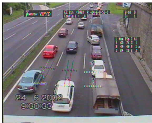
Obr. 5 Schéma a základní reálný videoobraz sledovaného odbočování

Zde je patrné jak vratná rampa pro kterou nestačí odbočovací pruh způsobuje „zahlcení“ pravého jízdního pruhu a tento vliv se postupně přenáší na ostatní jízdní pruhy (jak deklarují grafy závislosti), vozidla, která nechtějí čekat, odbočují až v bezprostřední blízkosti rampy tj. ze středního jízdního pruhu.