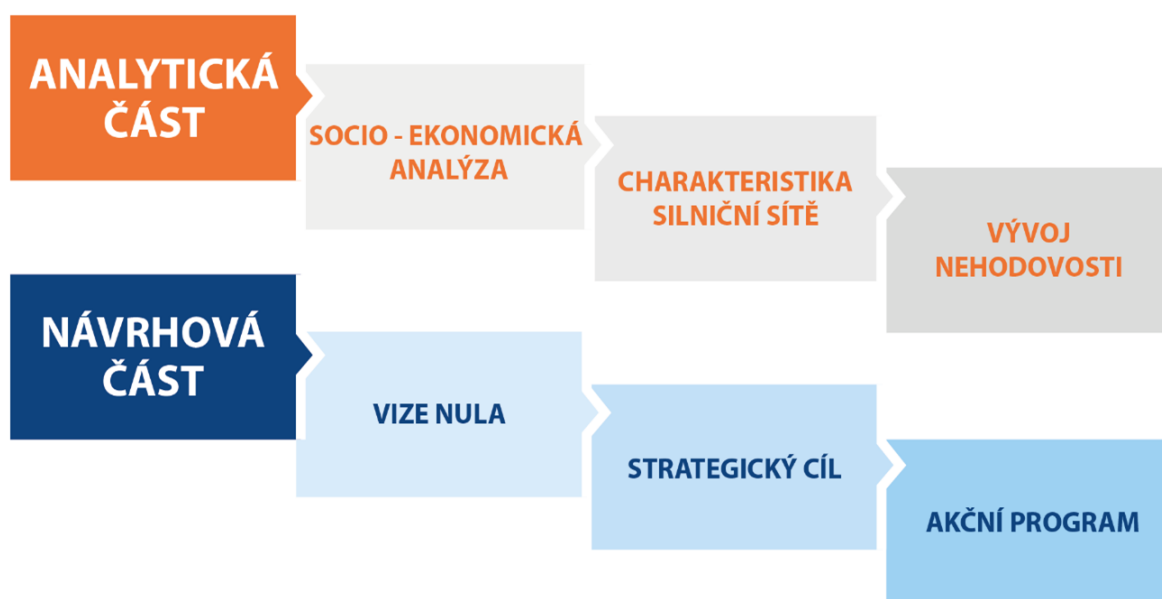
Obr. 1: Fáze zpracování strategie BESIP města (obce)

Jednotlivé fáze zpracování Strategie BESIP města (obce) jsou znázorněny na následujícím Obr. 1. Na analytickou část, která je tvořena socioekonomickou analýzou, charakteristikou sítě pozemních komunikací a vývojem nehodovosti, navazuje část strategická a realizační s konkrétními opatřeními navrženými akčním plánem.