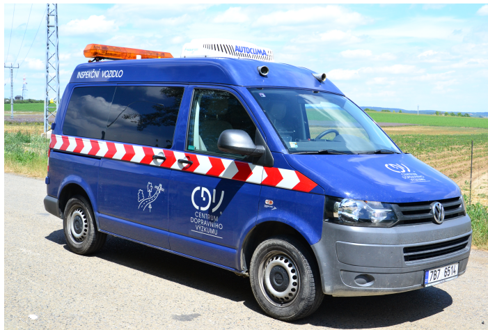
Měřicí vozidlo (inspekční vozidlo)