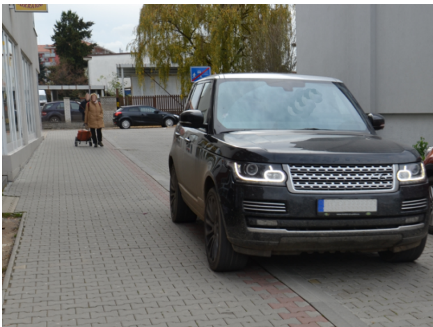
Obrázek 06. Benešov - před osazením