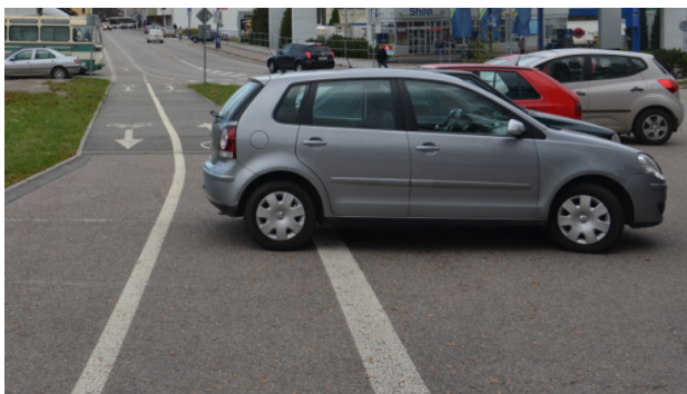
Obrázek 14. Benešov - před osazením (říjen 2013)

Jako další lokalita pro implementaci byla vybrána odstavňá plocha pro vozidla, která je současně účelovou komunikací. Geometricky je v souběhu s cyklostezkou. Na této lokalitě docházelo k nelegálnímu odstavování/parkování vozidel ve vyhrazeném pruhu pro cyklisty. Řidiči tak porušovali § 27 zákona č. 361/2001 Sb., odstavec (i) na vyhrazeném jízdním pruhu (viz Obrázek 14).