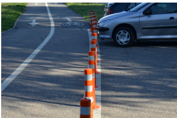
Obrázek 16. Benešov - 3 měsíc (srpen 2014)

Na Obrázek 15 jsou zachyceny flexibilní regulační sloupky krátce po jejich osazení. Ihned tak vznikla optická bariéra, která je ohleduplná (odpouštějící) ke zranitelným účastníkům silničního provozu.