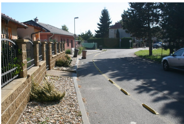
Obrázek 10. Břeclav – před osazením

V tomto případě se jedná o obousměrnou dvoupruhovou komunikaci bez přilehlých chodníků. Právě kvůli absenci chodníků a poměrně velkému provozu pěších byla na široké komunikaci oddělena pěší doprava vodorovným značením a pomocí nízkých parkovacích zářežek. Tyto zářežky nesly známky častého přejíždění a byly ve velmi špatném stavu. Vybudování chodníku prozatím nepřipadalo v úvahu kvůli majtkovému vypořádání pozemků, proto město zvolilo nízkonákladové prozatímní řešení pomocí flexibilních sloupků. Na lokalitu bylo osazeno 24 ks sloupků průměru 80 mm výšky 750 mm. Kotvení sloupků proběhlo opět povrchovým způsobem pomocí kotev do živичného povrchu komunikace.