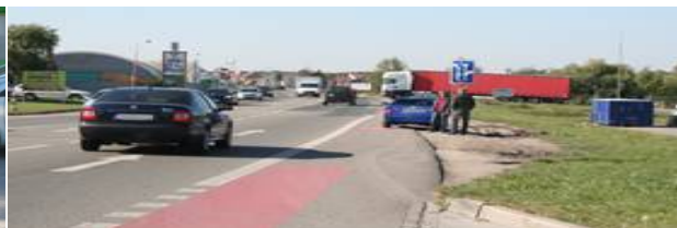
Obrázek 03. Stání na silniční vegetaci (§ 27 písm. r, i)