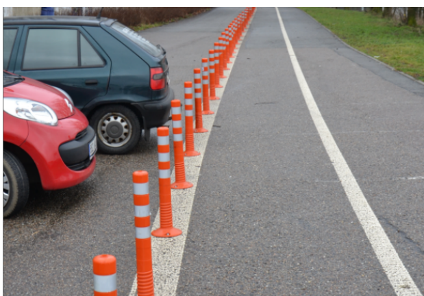
Obrázek 18. Benešov - 8 měsíc (leden 2015)

Z hlášení PČR v městě Benešov nevyplývá, že by na lokalitě dále docházelo k porušování zákona. Vozidla již nezasahují do jízdního pruhu vyhrazeného pro cyklisty. Z video monitoringu lze doložit maximálně kontakt přídě vozidla se sloupkem a to bez následku.