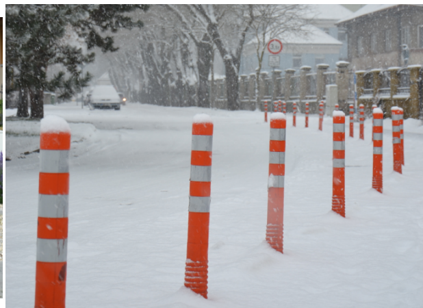
Obrázek 13. Břeclav - zimní období

Závěrem lze konstatovat, že v této lokalitě byly sloupky přijaty veřejností po roční zkušenosti kladně, povrchové kotvení pomocí hmoždinek do živичného povrchu je vhodný způsob kotvení a sloupky plní svoji funkci velmi dobře.