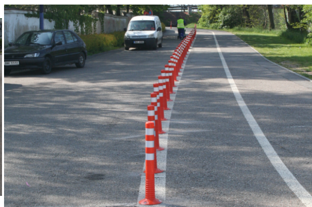
Obrázek 15. Benešov - po osazení (květen 2014)

Na Obrázek 15 jsou zachyceny flexibilní regulační sloupky krátce po jejich osazení. Ihned tak vznikla optická bariéra, která je ohleduplná (odpouštějící) ke zranitelným účastníkům silničního provozu.