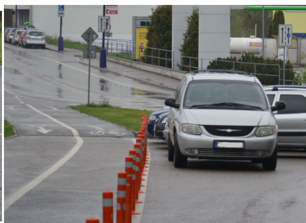
Obrázek 19. Benešov - 12 měsíc (duben 2015)