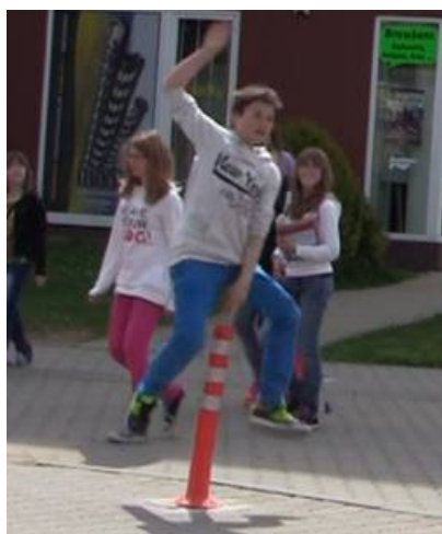
Obrázek 20. Benešov - 12 měsíc

Dalšími výhodami sloupků je jejich snadná/rychlá montáž a výměna, variabilita provedení (design), nízká cena v porovnání se stavebními úpravami.