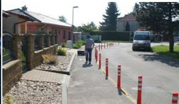
Obrázek 11. Břeclav – krátce po osazení

Pohyb chodců zůstal zachován na vymezeném prostoru. Do odděleného prostoru se přesunuli i cyklisté (v navazující ulici za křižovatkou je pro ně vyhrazený jízdní pruh a vznikla tak návaznost trasy). Reakcí rezidentů a majitelů přilehlých nemovitostí byl spíše údiv. Padlo pár předpovědí: „Tohle tady nemůže přece přežít.“ Opak je pravdou. Všechny sloupky přešly monitorovací období bez úhony pouze s drobnými oděrkami na exponovaných místech (odstraněn byl pouze jeden sloupek, který majitelům přilehlé nemovitosti překážel ve vjezdu – ovšem až po 11 měsících provozu). Nejvíce trpěly krajní sloupky a sloupky po krajích vjezdů. Místa byly strženy reflexní pásy, ale jinak dopravní a klimatické zatížení nemělo žádný vliv na tvar nebo funkci sloupků.