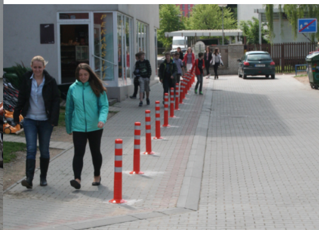
Obrázek 07. Benešov - krátce po osazení

Pohyb chodců se ihned po osazení sloupků usměrnil do vymezeného prostoru. Po osazení sloupků došlo k zamezení odstavování vozidel v tomto prostoru (viz Obrázek 07). Reakce rezidentů byly však různé. Učitelky z blízké školy téměř s nadšením kvitovaly nové opatření s tím, že něco takového bylo dlouho potřeba. Naopak místní obchodníci s nastalou situací vyjádřili poměrně hlasitý nesouhlas. A tak vozidla pro zásobování byla stále odstavována v blízkosti obchodů, ale nyní už za sloupky. Bohužel v krátkém časovém období (cca dva měsíce) byly některé sloupky zničeny neznámým vandalem. Situaci řešila Policie ČR jako přečin Poškození cizí věci. Nutno přiznat, že kotvení sloupků v zámkové dlažbě v této lokalitě nebylo příliš efektivní. Dlažba byla pro povrchové kotvení pomocí hmoždinek a krátkých šroubů příliš nekompaktní. Městu byla nabídnuta okamžitá výměna sloupků s tím, že by všechny sloupky byly zakotveny do nové betonové patky. Zástupci města chtěli situaci řešit komplexně a rozhodli se vybudovat odstavná stání pro zásobování a teprve poté sloupky znovu osadit.