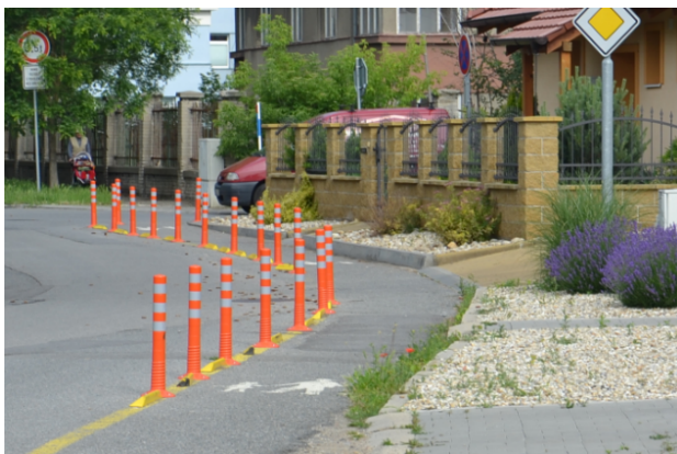
Obrázek 12. Břeclav - letní období