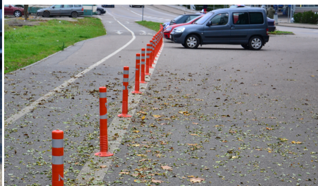
Obrázek 17. Benešov - 5 měsíc (říjen 2014)

Jak je znázorněno na obrázcích 15, 16 a 17 tak i několik měsíců po osazení porušování § 25 vymizelo.