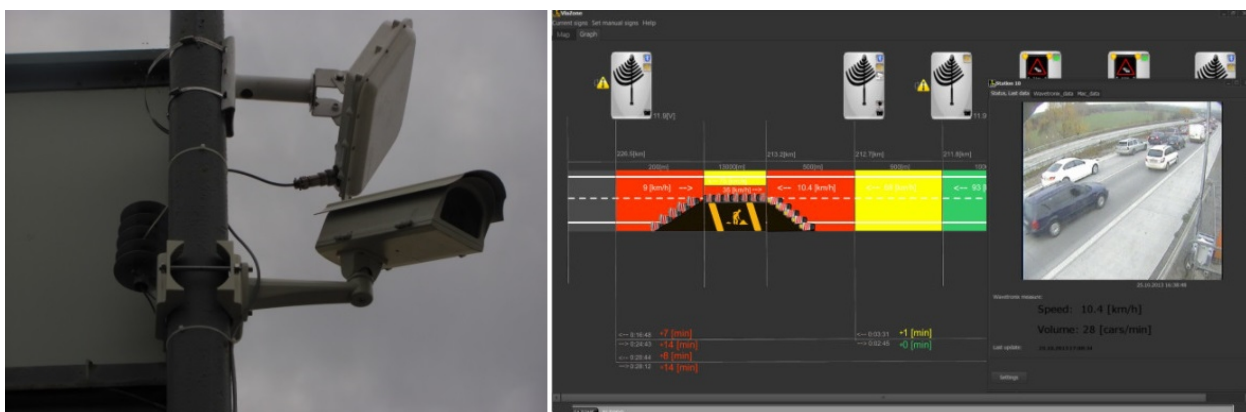
Obr. 1 - Přenosné dopravní detektory (vlevo) a řídicí SW přenosného řídicího systému ViaZONE, který byl vyvinut a pilotně otestován na dálnici D1 v roce 2013

Druhým projektem je Mezinárodní projekt ASAP (Appropriate Speed saves All People), který je součástí silničního výzkumného programu CEDR (Directors of Roads) 2012 řešený konsorciem čtyř výzkumných organizací (ČR/CDV, ITA/UNIFI, BEL/BRRC, RAK/AIT) vedených švédským VTI (Swedish National Road and Transport Research Institute). Projekt je řešen v letech 2013 až 2014. Hlavním cílem projektu ASAP je vyzkoušet efektivitu vybraných opatření, která povedou k lepšímu řízení rychlosti vozidel projíždějících pracovními místy, protože nedodržování nejvyšších dovolených rychlostí je celoevropským problémem a na pracovních místech o to závažnějším.