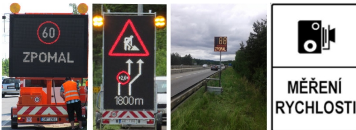
Obr. 3 - Testovaná opatření v místech dopravních uzavírek v rámci řešení projektu ASAP

Hlavním cílem projektu ASAP je vyzkoušet efektivitu vybraných opatření, která povedou k lepšímu řízení rychlosti vozidel projíždějících pracovními místy, protože nedodržování nejvyšších dovolených rychlostí je celoevropským problémem a na pracovních místech o to závažnějším. Z tohoto důvodu byl v rámci uvedeného projektu vytvořen seznam jednoduchých opatření nezasahujících do vozovky (zobrazování aktuální dosahované rychlosti, použití proměnných dopravních značek při překročení nejvyšší dovolené rychlosti, zdůraznění/opakování dopravní značky č. A 15 Práce na silnici, instalace dopravní značky č. IP 31 a Měření rychlosti).