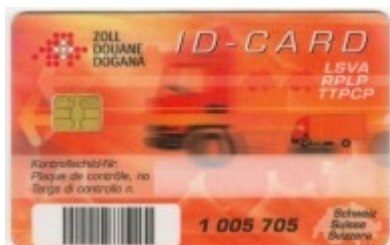
Obr. 3: Čipová ID karta

Všechna tuzemská nákladní vozidla s hmotností nad 3,5 tuny musí být povinně vybavena OBU jednotkou, existuje asi jen 500 výjimek. Zahraniční vozidla mohou být vybavena OBU jednotkou, ale nemusí, pak provádí platbu za ujeté km hotově pomocí terminálů. V současnosti je u zahraničních vozidel nainstalováno pouze cca 2 000 ks OBU jednotek (především se jedná o vozidla z příhraniční oblasti). OBU jednotky jsou distribuovány dopravcům zdarma, uživatel platí jejich instalaci do vozidla. Cena instalace OBU se pohybuje v rozmezí 250,- až 300,- CHF.