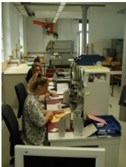
Obr. 2: Zúčtovací pracoviště v Bernu

Denně se výběr poplatků týká cca 52 000 vozidel a 30 000 přívěsů ve vnitrostátní přepravě a cca 21 000 vozidel zahraniční přepravy (cca 50% z těchto vozidel představuje vjezd přes státní hranice a cca 50% výjezd za hranice státu). Jak již bylo shora uvedeno, výběr poplatků za použití švýcarských komunikací podle výkonu se týká všech vozidel s maximální celkovou hmotností nad 3,5 tuny. Protože je výběr prováděn za každý ujetý km v kompletní silniční síti, jedná se o plošný výběr.