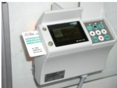
Obr. 1: OBU - palubní jednotka On Board Unit

Výběr poplatků (mýtného) podle výkonu (na základě počtu ujetých km) pro všechny nákladní automobily nad 3,5 tuny určené pro převoz zboží představuje 97% všech výnosů. Další 3% poplatků jsou realizovány formou výběru paušálních poplatků (ročních, denních) za provoz autobusů, přívěsů, apod. Výjimky z placení poplatků platí pro vojenská vozidla, vozidla policie, hasičů a záchranné služby, vozidla s elektrickým pohonem a některé další speciální případy (např. vozidla svážející dřevo).