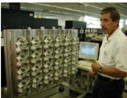
Obr. 6: Testování OBU ve výrobním závodě FELTA

Významným prvkem v systému je i ochrana dat. Systém je konstruován tak, aby byla využívána k přenosu pouze ta data, která jsou nezbytná pro stanovení výše poplatku za ujeté kilometry po silnicích. Všechna ostatní data se sbírají pro účely využití ve firmě dopravce a proto tam také zůstávají. GPS data se v současnosti v systému neukládají. OBU jednotky lze už dnes kombinovat s elektronickým tachografem. Využití stávajících zařízení v systému LSVA pro další telematické aplikace se netýká provozovatele systému, tedy ani státu, avšak zařízení, především rozhraní OBU jednotek je připraveno k využití v těchto aplikacích, např. lze připojit vlastní sledovací systémy, apod. Co se týče interoperability systému LSVA se státy EU, systém LSVA bude interoperabilní se systémem zaváděným v Rakousku, o interoperabilitě se systémem zaváděným v SRN se v současnosti intenzívně jedná. V rámci projektu TIS (sdružuje dodavatele EFC systémů ve Španělsku, Francii, Itálii a Řecku) se řeší interoperabilita mezi současně provozovanými EFC systémy v těchto zemích a připravovanými systémy EFC v Evropě vč. provozovaného LSVA s ohledem na platné a nově přijímané normy v rámci CEN TC 278 pro oblast EFC.