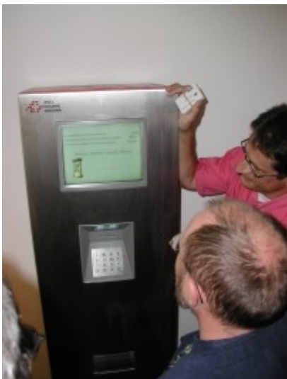
Obr. 5: Terminál systému LSVA

Předpokládá se, že do r. 2006 vzrostou výnosy z vybraných poplatků ze systému LSVA na cca 1,5 mld. CHF. Tento téměř dvojnásobný nárůst bude způsoben navýšením poplatku za použití kilometru silniční sítě a také i tím, že od 1.1.2004 budou moci dopravci po silniční síti jezdit se soupravami o celkové hmotnosti až do 40 tun (dnes je hranicí 34 tun a hranice 40 tun platí pouze v příhraničním pásmu do 10 km). Za zajímavost stojí i fakt, že před zavedením systému LSVA se uvažovalo se zavedením poplatku za použití kilometru silnice, který měl být čtyřnásobkem poplatku dnešního. Provozovatelé systému LSVA předpokládají, že se v systému vyskytuje cca 1% podvodů, přesné číslo však není známo. Podvody jsou zjišťovány především v deklaraci přívěsů – OBU jednotka zaznamenává pouze přítomnost přívěsu, nezjistí jeho váhu.