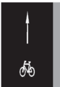
Jízdní pruh pro cyklisty V 14

Značka vyznačuje pruh nebo stezku pro cyklisty. Šipka vyznačuje stanovený směr jízdy.