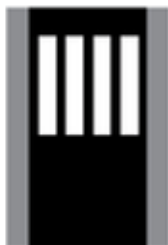
Přechod pro chodce V 7a

V souladu s výkladem zákona č. 361/2000 Sb., o provozu na pozemních komunikacích KOLOBĚŽKÁŘ V ROLI CHODCE před přechodem pro chodce musí jezdec na koloběžce z koloběžky sesednout a koloběžku přes přechod jen vést, nesmí na ní jet. Rozhlíží se kolem sebe - vlevo a pak vpravo a zase vlevo. Na přechod může vstoupit až v okamžiku, kdy vidí, že vozidla zastavují a tzv. „pouští“ chodce na přechod přes silnici.