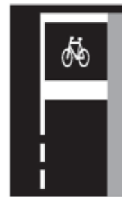
Prostor pro cyklisty V 19 (jezdce na koloběžce)

Značka vyznačuje plochu určenou pro přejezd cyklistů přes pozemní komunikaci bezprostředně sousedící s přechodem pro chodce. Plocha určená pro přejezd cyklistů přes pozemní komunikaci může být zvýrazněna určeným symbolem nebo značkou „Jízdní pruh pro cyklisty“.