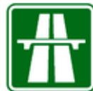
Dálnice IZ 1a