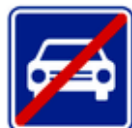
Konec silnice pro motorová vozidla IZ 2b