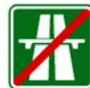
Konec dálnice IZ 1b

Dopravní značky jsou obsahem Přílohy č. 1 k vyhlášce č. 294/2015 Sb. , kterou se provádějí pravidla provozu na pozemních komunikacích.