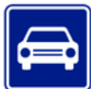
Silnice pro motorová vozidla IZ 2a