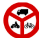
Zákaz vjezdu vyznačených vozidel B 12

Značka zakazuje vjezd cyklistům/jezdcům na koloběžce a jízdu na jízdním kole/koloběžce. Vedení koloběžky je povoleno.