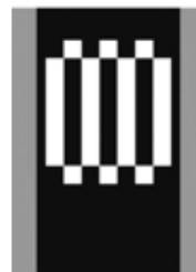
Sdružený přechod pro chodce a přejezd pro cyklisty V 8c

Zde jezdec na koloběžce přes přejezd jede, nesedá.