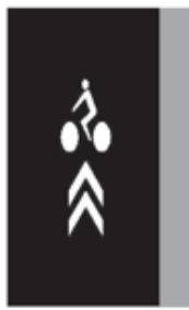
Piktogramový koridor pro cyklisty V 20

Značka vyznačuje pruh nebo stezku pro cyklisty. Šipka vyznačuje stanovený směr jízdy.