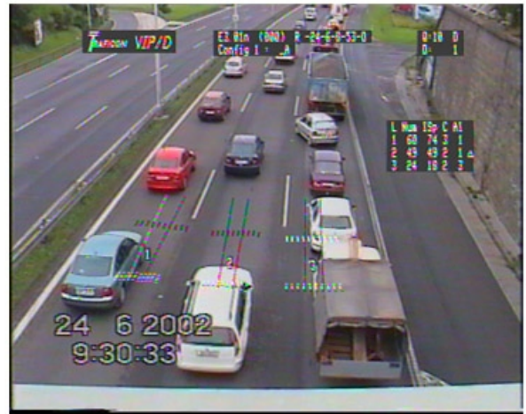
Obr. 5 Schéma a základní reálný videoobraz sledovaného odbočování

Zde je patrné jak vratná rampa pro kterou nestačí odbočovací pruh způsobuje „zahlcení“ pravého jízdního pruhu a tento vliv se postupně přenáší na ostatní jízdní pruhy (jak deklarují grafy závislosti), vozidla, která nechtějí čekat, odbočují až v bezprostřední blízkosti rampy tj. ze středního jízdního pruhu.