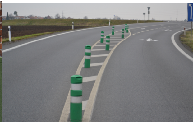
Obrázek 09. Směrové sloupky zelené kulaté - baliseta

V ČR doposud nebyl zpracován ucelený podklad (manuál) pro navrhování a umísťování tohoto typu dopravně bezpečnostního a dopravně výchovného zařízení, které zvyrazňující regulační sloupky představují. Poznatky zde prezentované byly z části získané v rámci řešení VaV projektu „Implementace flexibilních sloupků jako prvků městského inženýrství“, na který poskytla účelovou dotační podporu Technologická agentura ČR v letech 2013 až 2015 s označením TA03030747. Hlavním výsledkem projektu byla „Metodika navrhování flexibilních regulačních sloupků“ [01], která je po registraci od prosince 2015 dostupná na projektových stránkách www.flexi.cdvinfo.cz .