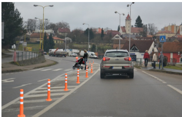
Obrázek 06. Flexibilní regulační sloupky - oranžové

Balisety jsou zde zvoleny jako podpora vodorovného dopravního značení, což je v souladu se vyhláškou č. 294/2015 Sb. [12], ale není v souladu s TP 58 [05]. Umístění baliset na obr 07. z pohledu vzdálenosti od přechodu je nedostatečné. Pokud jsou balisety umístěny jako podpora rozhledu, měly by vymezit prostor pro rozhled ve vzdálenosti 5 m před přechodem, aby zabránily nelegálnímu zastavení vozidel na přechodu a před přechodem dle odstavce (c) § 27 zákona č. 361/2000 Sb. [09].