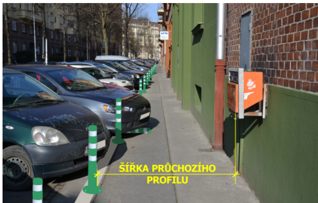
Obrázek 08. Flexibilní regulační sloupek - zelený

Na obr. 08 je provedena grafická simulace osazení zelených flexibilních sloupků jako podpora zachování šířky průchozího prostoru chodníku v obci. Právě v těchto situacích spočívá hlavní ohnisko využití flexi sloupků. Sloupek vozidlo nepoškodí, ale klade dostatečný odpor, aby si řidič uvědomil, že najíždí do jemu zakázaného prostoru. Realizace balisety v tomto místě je sice možná, ale její profil by zbytečně zabíral cenné centimetry přidruženého prostoru komunikace v obci. Na obr. 09 je znázorněno vhodné použití balisety jako podpory vodorovného dopravního značení na silnici I. třídy mimo obec. Zelený sloupek s bílými odrazovými plochami vymezuje prostor určený pro dopravní stín.