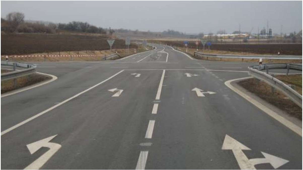
Obr. 1 Komfortní uspořádání vedlejší silnice nepodporuje povinnost dát přednost v jízdě