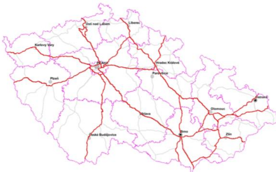
Obr. 4 Mapa sítě TEN-T v ČR, stav k roku 2012

Následující text se pokusí na některé otázky odpovědět. Pro zodpovězení všech otázek by však byla nutná komplexní analýza sítě TEN-T.