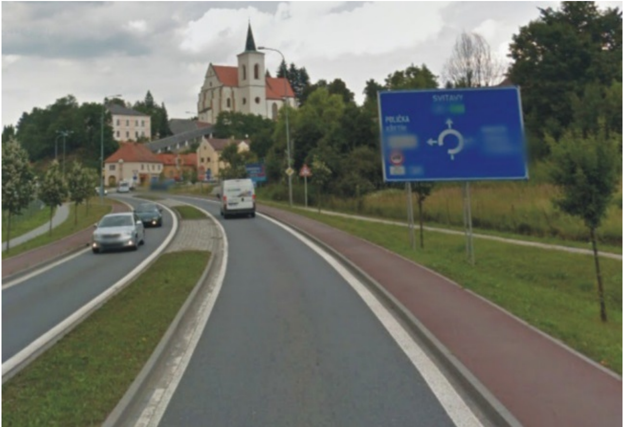
Obr. 5 Různorodost dopravního prostředí v rámci sítě TEN-T