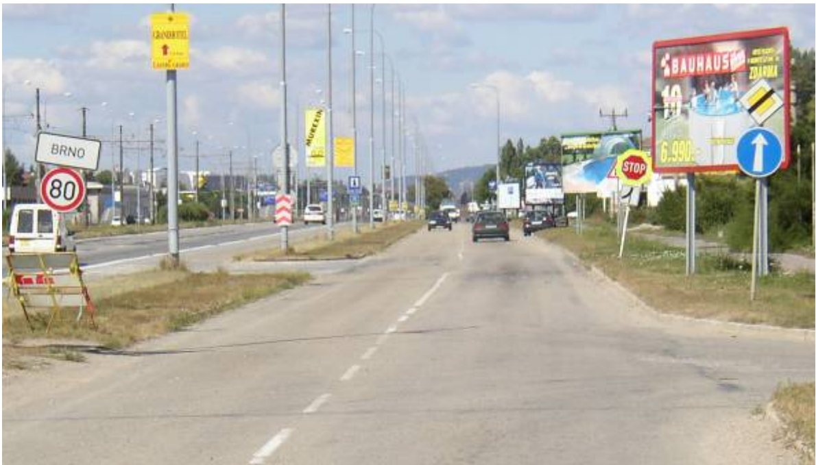
Obr. 2 Dopravní značka „Stůj, dej přednost v jízdě“ zaniká ve změti reklam

Významný impulz pro zkvalitnění systému managementu bezpečnosti pozemních komunikací v ČR přinesla v roce 2011 transpozice směrnice Evropského parlamentu a Rady 2008/96/EC o řízení bezpečnosti silniční infrastruktury do právního řádu České republiky. Zákonem č. 152/2011 Sb., kterým se mění zákon č. 13/1997 Sb., vyhláškou č. 317/2011 Sb., kterou se mění vyhláška č. 104/1997 Sb., a směrnicí pro dokumentaci staveb PK byla zavedena povinnost provádět nástroje (postupy) směrnice na komunikace transevropské sítě TEN-T ve všech fázích projektování, výstavby a provozu. Mezi nástroje směrnice patří 1) hodnocení dopadů na bezpečnost silničního provozu u vyhledávacích studií, 2) audity bezpečnosti silničního provozu, 3) klasifikace vybraných úseků silniční sítě a navazujících prohlídek na místě (v obrázku 3 zkráceně nazvána jako „provádění prohlídek vybraných úseků“) a 4) provádění bezpečnostních inspekcí. Každý nástroj má svá specifika a používá se v různých fázích životnosti komunikace (obrázek 3).