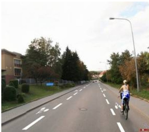
Obrázek 4 - animace řešení (ADOS, s r.o.)

Řešení se též s velkou výhodou uplatní např. před světelně řízenými křižovatkami, kde je tak cyklistovi zaručena možnost objet frontu čekajících vozidel a přijet až k SSZ (jde o vynikající formu preference cyklistů, viz obrázky 5 a 6).