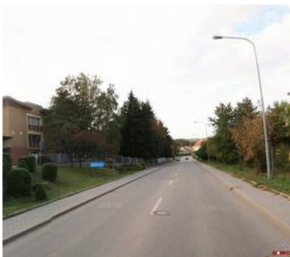
Obrázek 3 - současný stav

Víceúčelový pruh je tedy motivován snahou odsunout automobily dále od pravého okraje vozovky a lépe využívat jinak málo pojížděný střed vozovky tak, aby pro cyklisty zůstávalo vpravo volné místo pro jízdu ( viz obrázky 3 a 4 ).