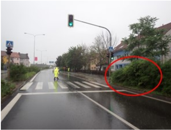
Neudržovaná zeleň v blízkosti přechodu pro chodce

Na Obr. č. 15 je zobrazena možnost spatření chodce řidičem osobního vozidla, které je vzdálené 15 m od přechodu. Kvůli vzrostlé zeleni není možné spatřit chodce dříve. Při rychlosti vozidla 50 km/h a uvažované reakční době 0,8 s je schopen řidič začít brzdit pouhé 3 m před přechodem, což znemožňuje včasné zastavení vozidla před přechodem.